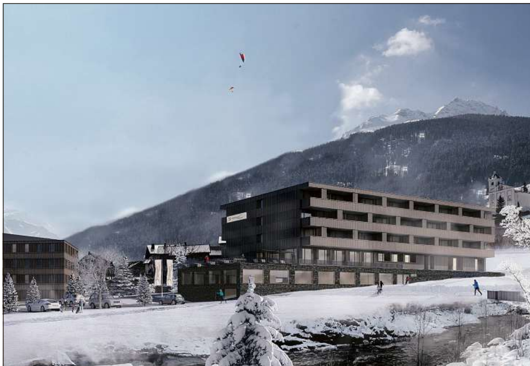
Ina visualisaziun da l'hotel che vegn construi a Grava amez Savognin.